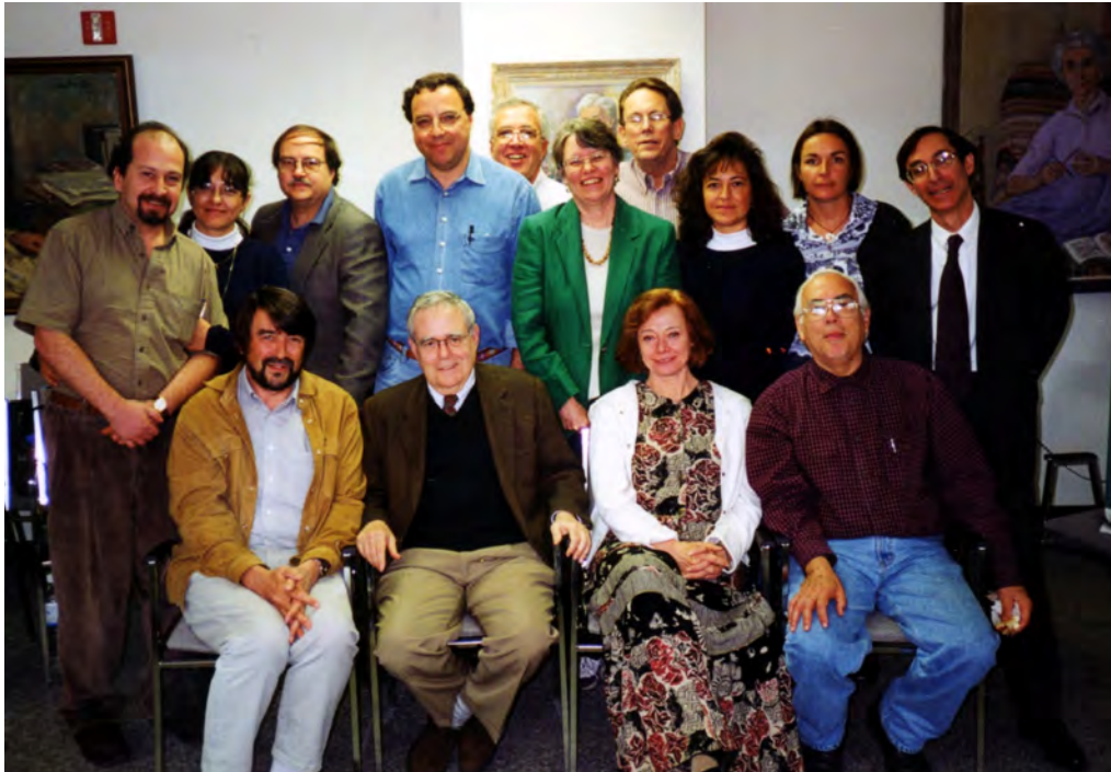
Jahr 2000 in Washington.